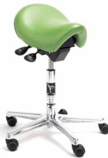
Bambach® Sattelsitz Cutaway Ergotherapeutischer Spezialsitz