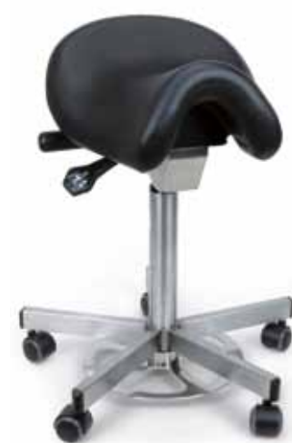
Bambach® OP Operations-Spezialsitz

Bitte gewünschte Farbe angeben – Farbmuster auf Anfrage.