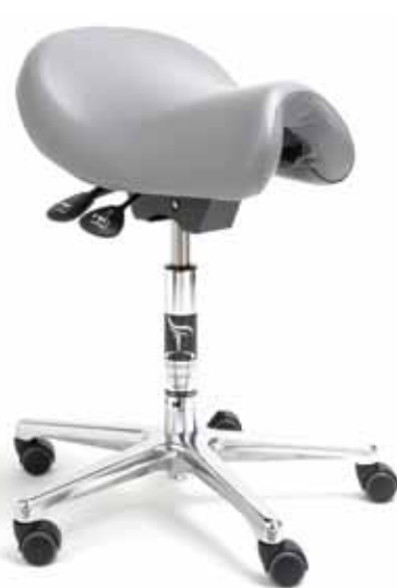
Bambach® Sattelsitz Large Ergotherapeutischer Spezialsitz

Bitte gewünschte Farbe angeben – Farbmuster auf Anfrage.