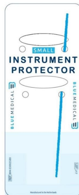
Instrument Protector small and Instrument Protector medium – Positionierung des Medizinprodukts – Sekundäranwendung