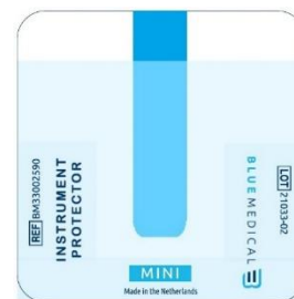
Instrument Protector mini – Positionierung des Medizinprodukts – Hauptanwendung