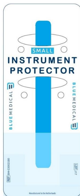
Instrument Protector small – Positionierung des Medizinprodukts – Hauptanwendung

Die nachfolgende schematische Darstellung dient nur als Orientierung!