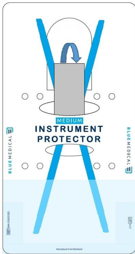
Instrument Protector medium – Positionierung des Medizinprodukts – Hauptanwendung